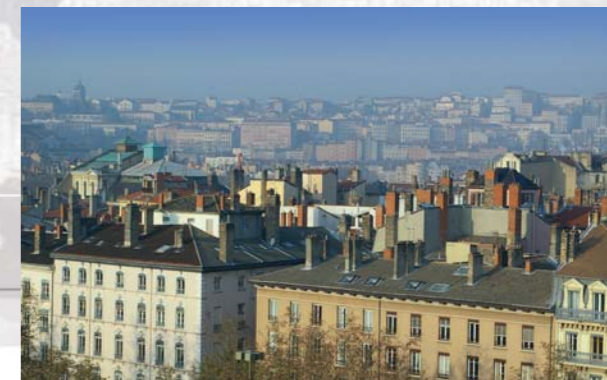
Lyon - centre ville