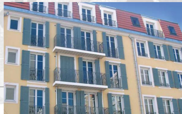
Ile-de-France - Chaville